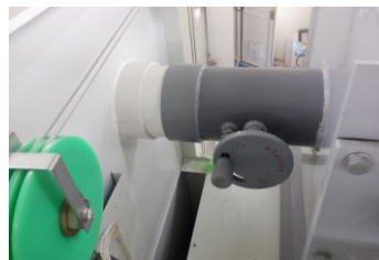
風量調整ダンパー部(左側にある)