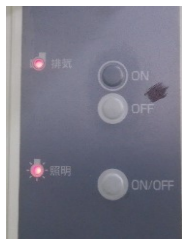
排気、照明スイッチ