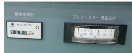
積算時間計(999Hr)、差圧計